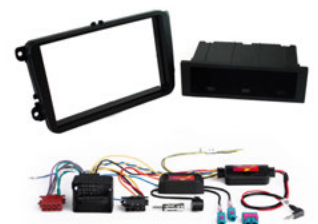
Beispiel-Abbildung: Einbau-Kit „Basic Diversity“

Einbau-Kit-„Vergleich“ auf der nächsten Seite